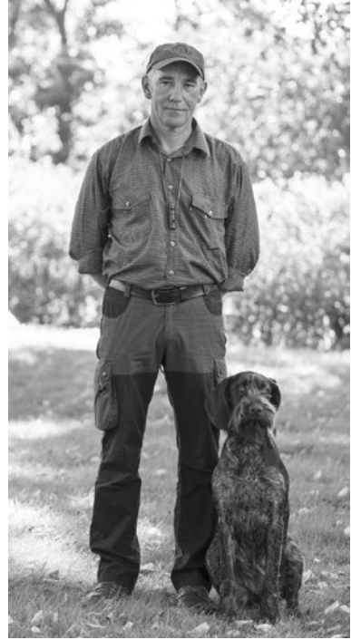
In Freundschaft die Mitglieder und der Vorstand der Gruppe Lüneburger Heide