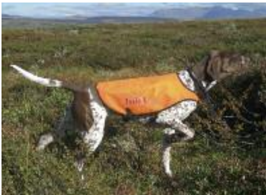
KV Vessinglias Tuva, 08824/08, Trygve Vevang, Ranheim