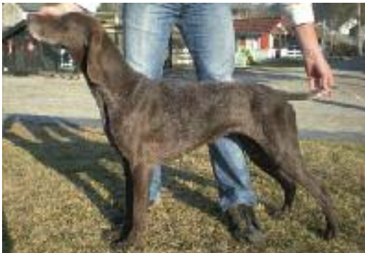
KV Rugdelias OZC Lita, 11340/07, Torbjørn Søgaard, Voss