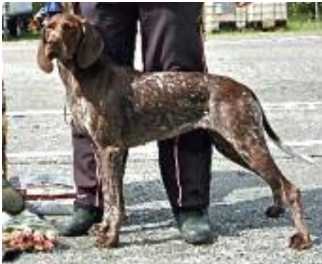
KV Rugdelias QLM L`Aquila, NO 37151/09, Tor-Aanen Kallekleiv, Rena